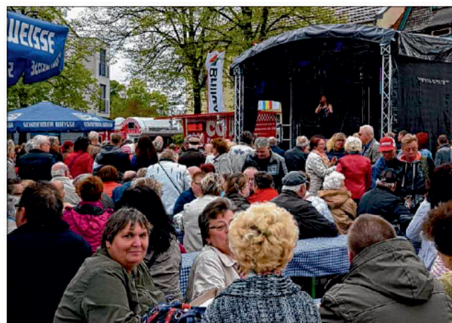
Tausende Besucher lauschten dem Programm auf der Bühne.