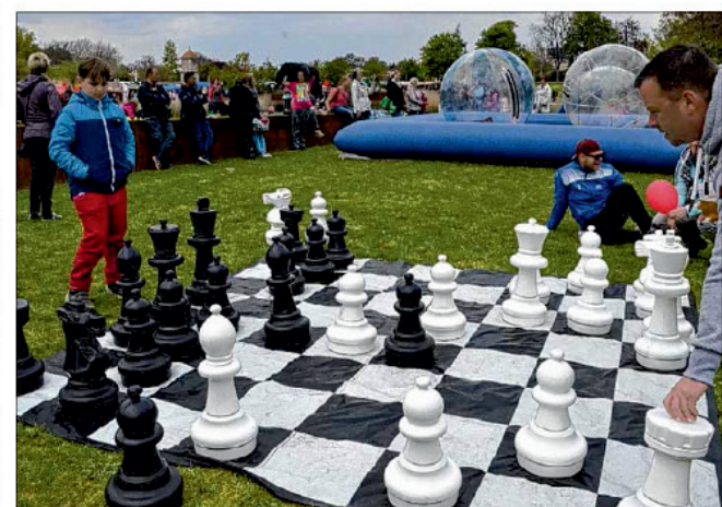
Bei der SG Einheit konnten die Besucher Schachspielen.