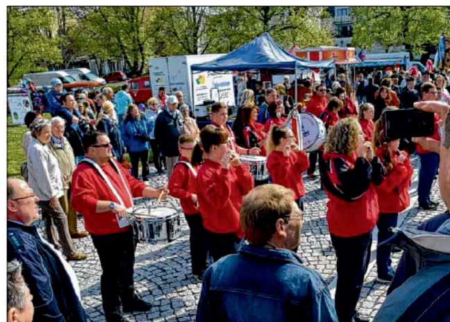
Der Spielmannszug Tarthun spielte zur Eröffnung auf.